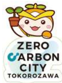
所沢市イメージマスコット トコロん

所沢市の事業者の皆様は、これまで様々な地産地消を進められてきました。例えば野菜の直売などもそうですが、「ところざわ醤油焼きそば」や所沢ブランド特産品の取り組みなど、食の地産地消は所沢市の魅力を高めるだけでなく、輸送に伴うCO 2 排出量を削減する脱炭素の取り組みの一つだとも思います。このように脱炭素には様々な関わり方があります。今後も所沢市は事業者の皆さまと一緒に、エコタウンの実現のためにできることを進めていきたいです。