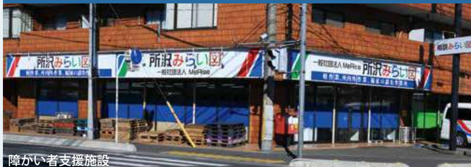
障がい者支援施設