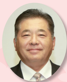
顧問 藤本正人 所沢市長