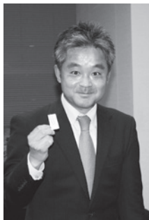
抽選会の様子(神保委員)