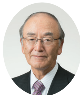
日本商工会議所 会頭 三村明夫

明けましておめでとうございます。 2020年の新春を迎え、謹んでお慶び申しあげます。