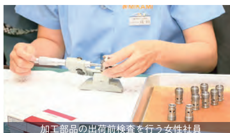
加工部品の出荷前検査を行う女性社員