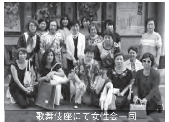
歌舞伎座にて女性会一同

7月25日(火)、歌舞伎座(東京都中央区)にて16名の参加のもと定例会「七月大歌舞伎鑑賞会」を開催しました。当日は、