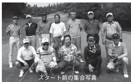
スタート前の集合写真

12名の参加のもと、西武園ゴルフ場にて親睦ゴルフを開催しました。これは、部会員同士の親睦を図り「化学反応」による新たな取引のきっかけづくりを目的に実施したものです。