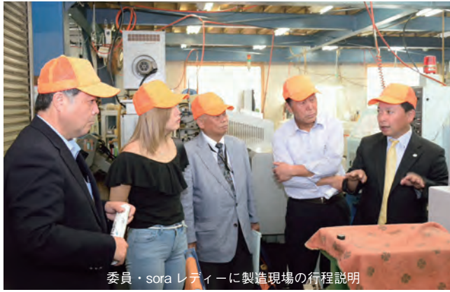
委員・sora レディーに製造現場の行程説明

平成27年には、さいたま市に(現)さいたま工場を開設しました。 現在は、様々な製品の金属加工を請け負っていて、取引先は大手メーカーをはじめとする約200社、従業員は40名、平均年齢が37歳と非常に若い会社です。