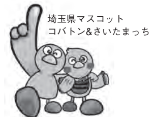
埼玉県マスコット コバトン&さいたまっちゃん