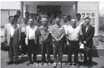
㈱ササキ本社前にて

7月7日(金)・8日(土) 17名の参加のもと、視察研修会を開催しました。1日目は、蕪崎市商工会へ表敬訪問し、