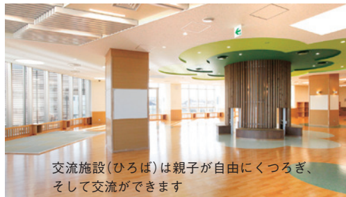
交流施設(ひろば)は親子が自由にくつろぎ、そして交流ができます

発達支援エリアでは、早期の発達障害に関する相談や支援をします。18歳未満の子どもの発達障害に関する相談や未就学児の親子教室等を無料で行います。発達障害は早い段階で発見できれば、訓練することで社会に適応できるので、4月から発達障害もしくはその心配のある、おおむね2歳半以降の未就学児を対象に障害児通所支援※2を行う予定です。所沢市全体の支援体制の向上を目指し、