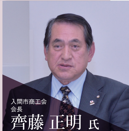
入間市商工会 会長

埼玉県西部地域商工団体トップ座談会 賑わい・潤い・ 活力みなぎる 西部圏域の まちづくり