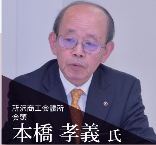
所沢商工会議所 会頭