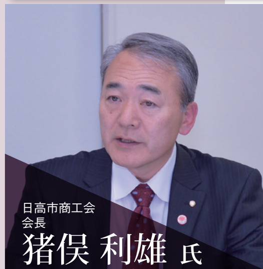
日高市商工会 会長

埼玉県西部地域の連携の強化、活性化を目的に西部地域の6商工団体（所沢・川越・飯能・狭山商工会議所と入間市・日高市商工会）の会頭・会長によるトップ座談会を、狭山市産業労働センターにおいて開催いたしました。今回は、昨年の飯能商工会議所に続き、狭山商工会議所が主管となり「賑わい・潤い・活力みなぎる西部圏域のまちづくり」をテーマに、様々な思いや施策を熱く語っていただきました。