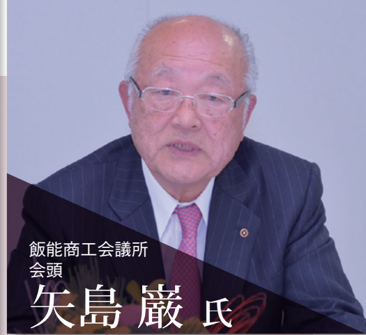
飯能商工会議所 会頭