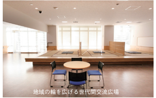
地域の輪を広げる世代間交流広場

りするコミュニケーションなどを展開します。2つ目は「地域活動の支援」です。福祉に関するサービス、制度や活動についての情報提供、ボランティア活動の支援、世代間交流の促進、健康の増進などの事業を行います。