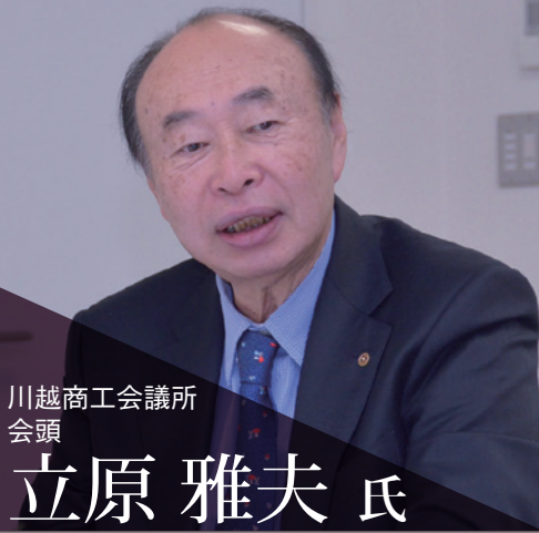
川越商工会議所 会頭