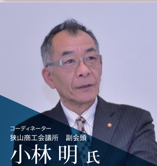
コーディネーター 狭山商工会議所 副会頭