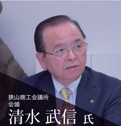
狭山商工会議所 会頭